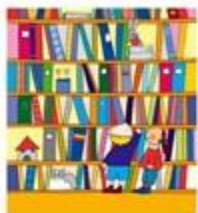
BIBLIOTECA DEI BAMBINI